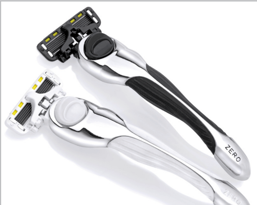
54 Shave-Lab: Produkte rund um die Rasur