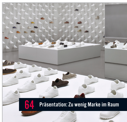
64 Präsentation: Zu wenig Marke im Raum