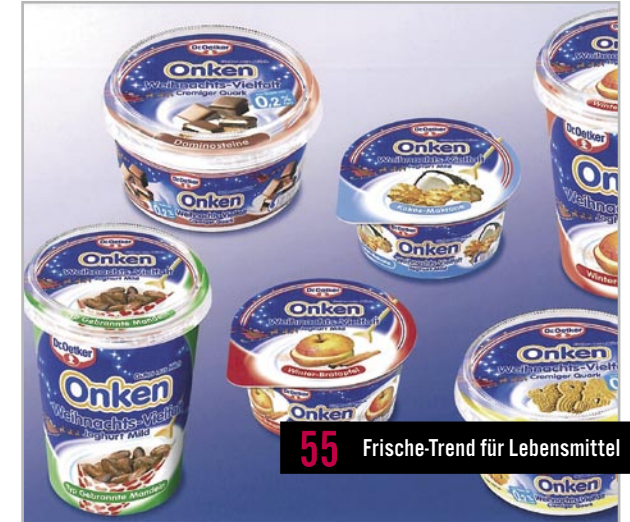
55 Frische-Trend für Lebensmittel