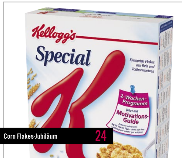
Corn Flakes-Jubiläum 24