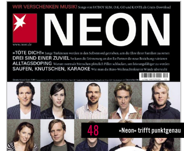
48 »Neon« trifft punktgenau