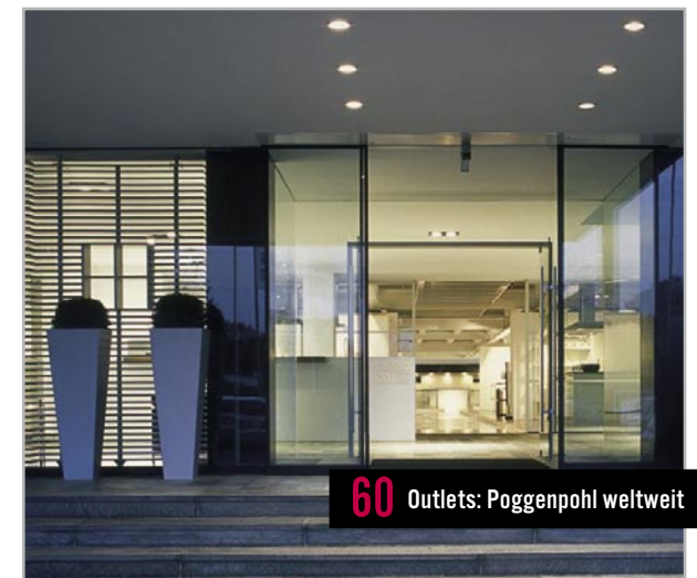
60 Outlets: Poggenpohl weltweit